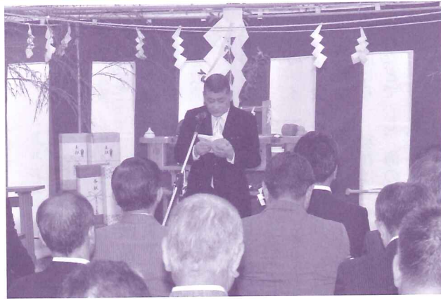
工事の安全を願い起工式が執り行われた

「平成28年度水産基盤整備事業」の採択を受けて、当組合が物を迅速かつ効率的に水揚げするため、現在、県にマイナス9メートル岸壁への増進工事を実施していただいております。これに併せて、建設するもので、鉄骨造り、床面積は三千五百平方メートルの規模となっております。高度衛生管理基本計画に基づいた衛生管理を重視した荷捌所で、床面については嵩上げをし、外周は腰壁を設置して、異物や車両等を制限し、鳥害防止として、四方へ防鳥ネットを設置する仕様です。 この防鳥ネットにつきましては、既存の第六バース荷捌所へも同様に設置し、水揚げされた漁獲物を極めて衛生的に取り扱うことができるようになり、消費者が求める安全・安心という