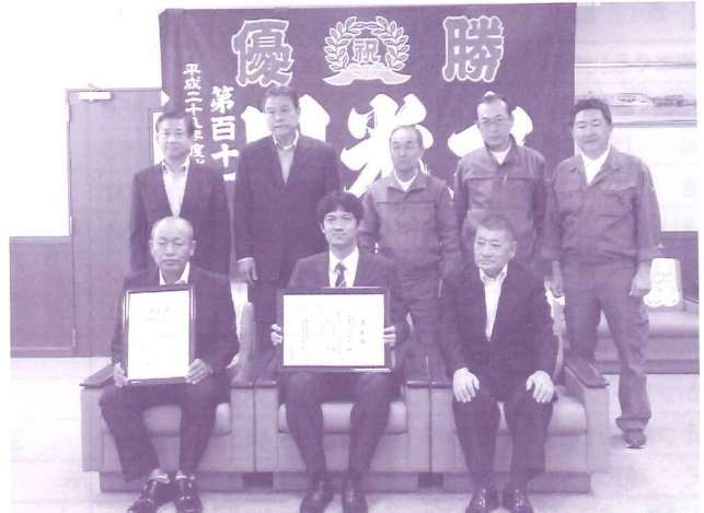
遠洋鯉漁船で優勝した「第111日光丸」の表彰